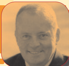
Hugues Martin, Député-Maire de Bordeaux

Le programme Urban2/Unicités contribue au développement de ces services de proximité essentiels pour la cohésion sociale et générateurs d'emploi. Nous souhaitons, dans cette nouvelle lettre d'information, valoriser toutes ces initiatives et par là même démontrer que l'Union européenne apporte un soutien réel et concret au développement de nos quartiers. Bonne lecture à tous !