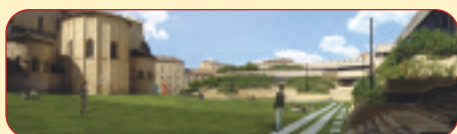
Le futur square Dom Bedos (2006)

Urban2/Unicité , accompagne pleinement cette mutation, qui vise à donner une image singulière au quartier Sainte-Croix. Grâce à ces multiples aménagements, le cadre de vie sera embelli et l'identité du quartier renforcée.