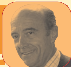
Alain Juppé, Député-Maire de Bordeaux.

*Bastia, Clichy sous Bois / Montfermeil, Grenoble / Fontaine / Seyssinet / Echirrolles / Pont de Claix, Grigny / Viry-Châtillon, Le Havre, Mantes la Jolie / Mantes la Ville, Les Mureaux / Ecquevilly et Strasbourg.