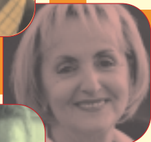
Conchita Lacuey, Députée-maire de Floirac