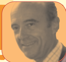
Alain Juppé, Député-maire de Bordeaux.

Vous pourrez ainsi constater que l'Europe est bien au cœur de nos quartiers. C'est une chance, profitons-en tous ensemble !